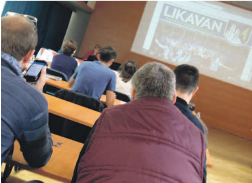
Novinári z celého Slovenska si v Tatrách vypočuli aj hodnotenie nášho periodika Likavan.

Záverom vyslovila konečné hodnotenie: „Likavan sa mi veľmi páči. Kvalitné periodikum s peknými