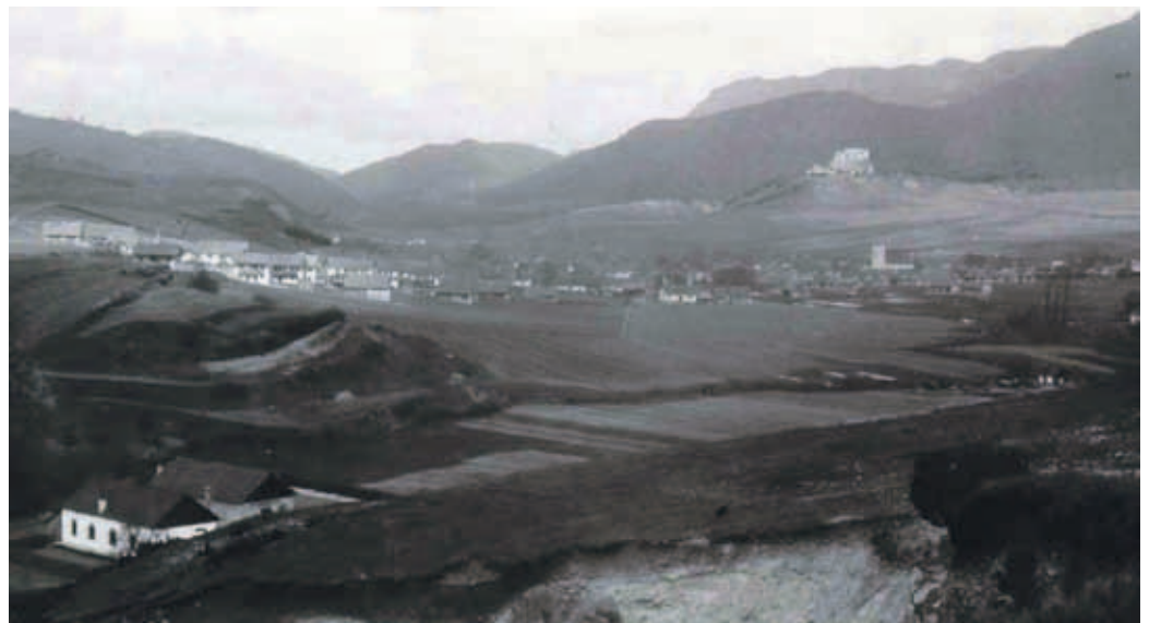
Pohľad na Likavku z úpätia Mnícha pred niekoľkými desaťročiami.