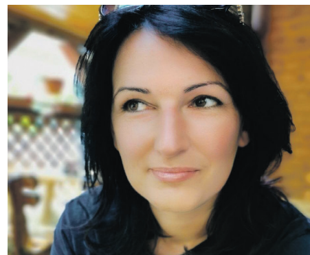
Futbal v Likavke