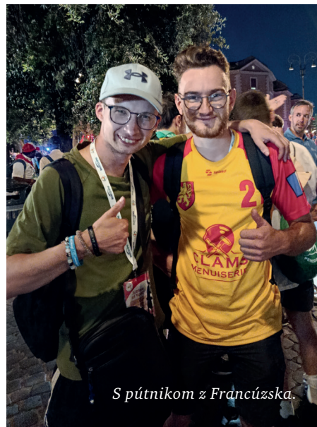
S pútnikom z Francúzska.

pápeža Františka, Baziliku svätého Pavla za hradbami a zlatým klincom nášho programu bola návšteva Baziliky svätého Petra vo Vatikáne. Nezabudnem ani na chvíle strávené pri slávnej fontáne di Trevi.