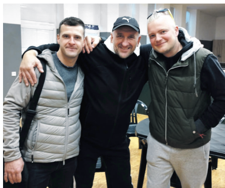
Chalani z farmy v Likavke