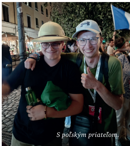
S poľským priateľom.

Výpravy za poznaním sme začínali vo Fiera di Roma. Stanice metra sú rozmiestnené po celom meste a dostať sa z jedného konca na druhý sa dá bez problémov a veľmi rýchlo. Počas dní mládeže sme navštívili štyri hlavné baziliky Cirkvi: Lateránsku, Santa Maria Maggiore, kde sme sa pomodlili pri hrobke