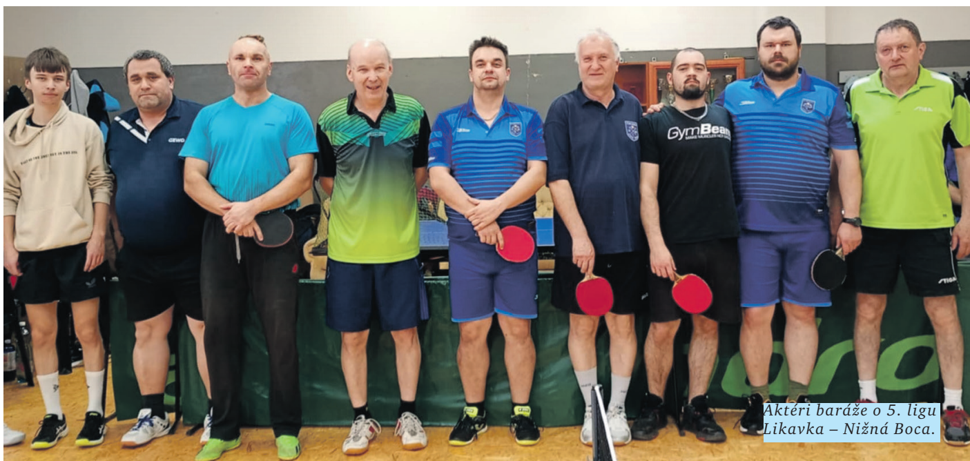
Aktéri baráže o 5. ligu Likavka – Nižná Boca.