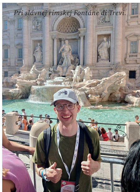
Pri slávnej rímskej Fontáne di Trevi.

Hlavné mesto Talianska sa na prelome júla a augusta zaplnilo účastníkmi celosvetových dní mládeže, ktoré sa zaradili medzi najdôležitejšie udalosti Jubilejného roka 2025.