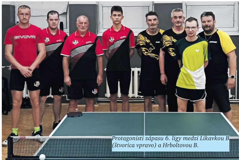
Protagonisti zápasu 6. ligy medzi Likavkou B (štvorica vpravo) a Hrboltovou B.

Likavka E: Debutujúce „ėčko“ podávalo vo svojej premiérovej sezóne sympatické výkony, čo ocenili súperi aj odborníci. V