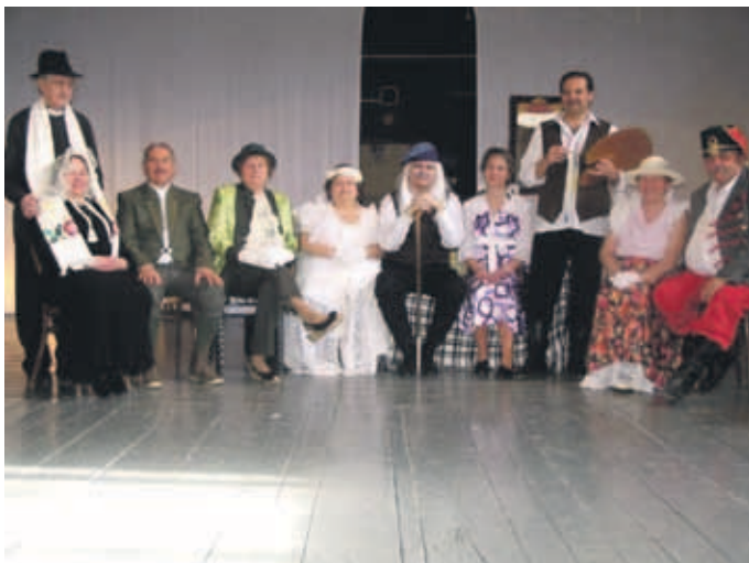
Predstavenie divadelníkov sa divákom veľmi páčilo.