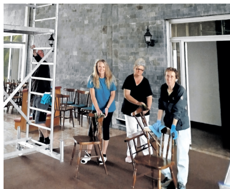
Vynovený Dom smútku