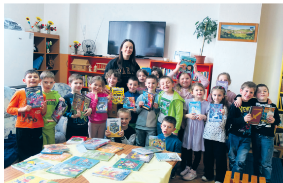
Z činnosti školského klubu