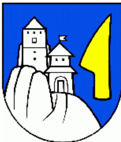
Vlajka obce Likavka